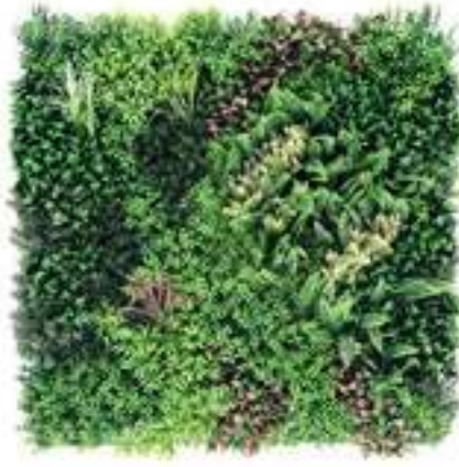
HERA modulo/module B U-A01BX100 cm 100 x 100