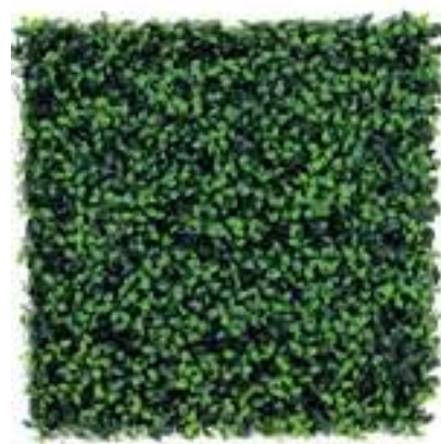
Gelsomino - Jasmine U.V.R. B-1506X100 cm 100 x 100