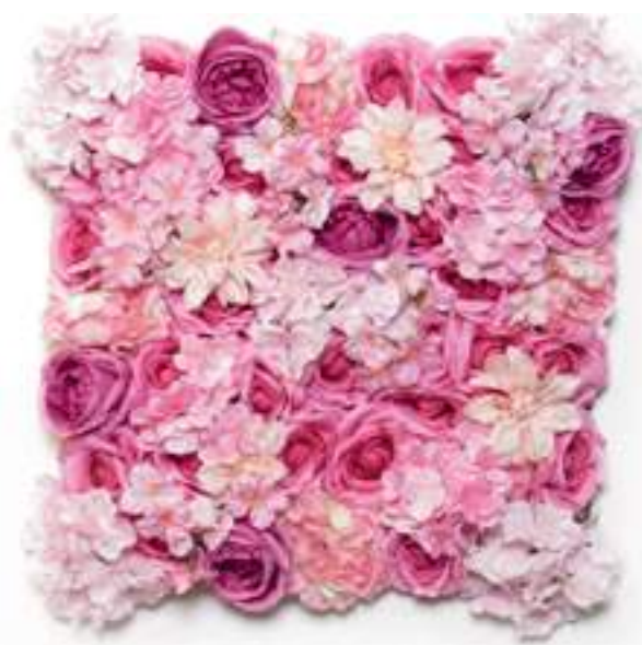
6-13002-DP Mattonelle Fiori Rosa Scuro Dark Pink Flower Mats cm 50 x 50, Pk. 10