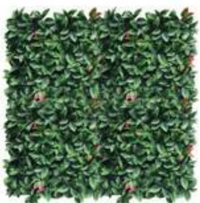
Photinia U.V.R. U-1510X100 cm 100 x 100