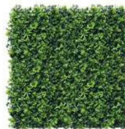
Greensea U.V.R. U-A156X100 cm 100 x 100