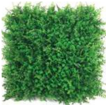
Small Jungle U.V.R. B-9008X50 cm 50 x 50