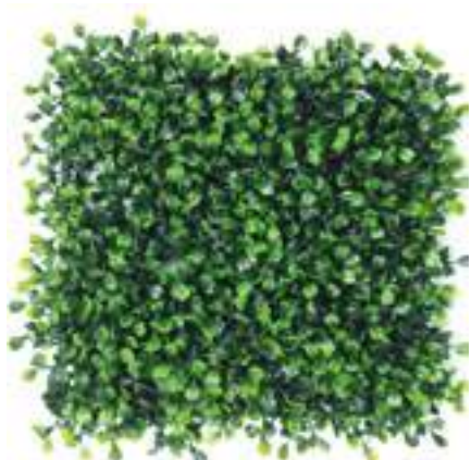
Boxwood U.V.R. D3523A-4 cm 50 x 50 cm D3523A-16 cm 100 x 100