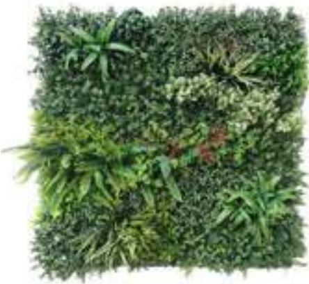
MADAGASCAR modulo/module A U-MAD100-A cm 100 x 100