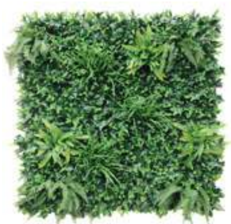
Greenery Low Cost U.V.R. U-1580X100 cm 100 x 100