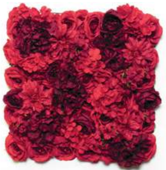
6-13001-R Mattonelle Fiori Rossi Red Flower Mats cm 50 x 50, Pk. 10