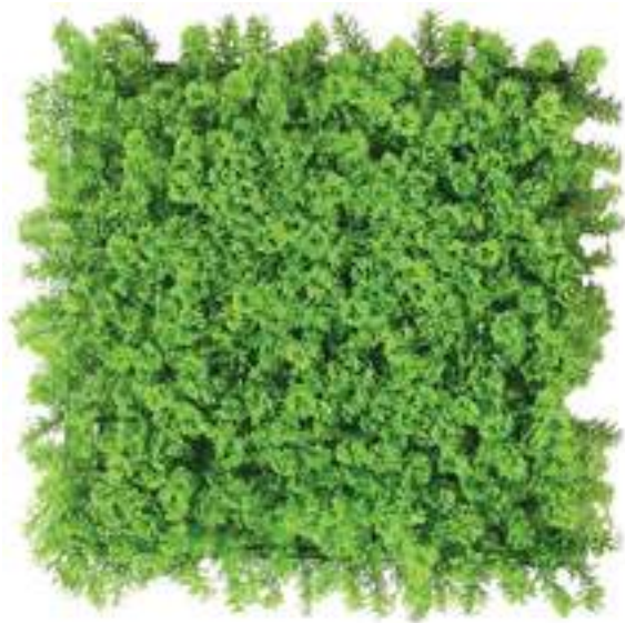
Lichene Artificiale Classic Artificial Lichen Classic Mattonelle Lichene UVR UVR Lichen Hedge Mats U-1530X100 cm 100 x 100, Pk. 6