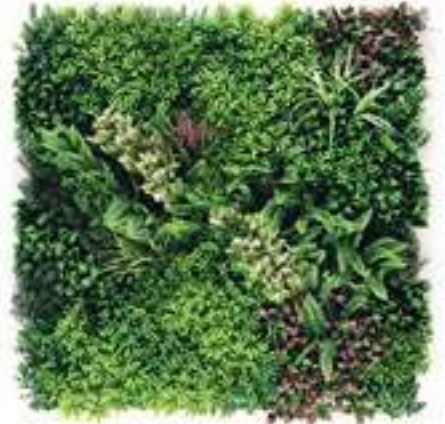
HERA modulo/module C U-A01CX100 cm 100 x 100