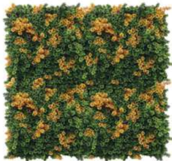
Lichene Artificiale Elegance Artificial Lichen Elegance Mattonelle Lichene UVR UVR Lichen Hedge Mats Col. Verde & Arancio/Green & Orange U-1730X100 cm 100 x 100, Pk. 5