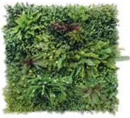
BALI modulo/module A U-BALI100-A cm 100 x 100