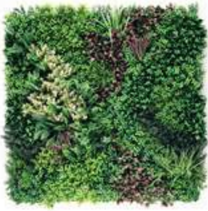
HERA modulo/module A U-A01AX100 cm 100 x 100