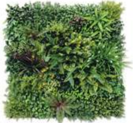
BALI modulo/module C U-BALI100-C cm 100 x 100