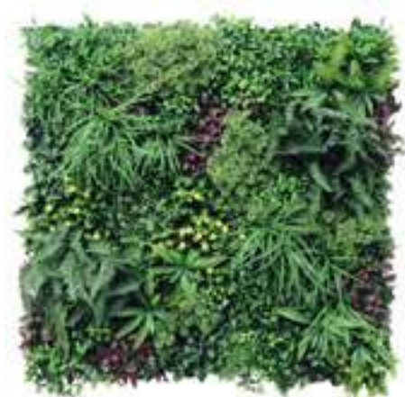
Wonderland U.V.R. U-A060X100 cm 100 x 100