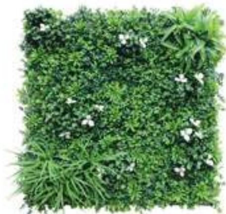
Desert Oasis U.V.R. U-A107X100 cm 100 x 100