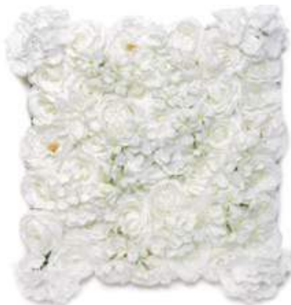
6-13004-W Mattonelle Fiori Bianchi White Flower Mats cm 50 x 50, Pk. 10