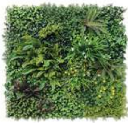
BALI modulo/module B U-BALI100-B cm 100 x 100