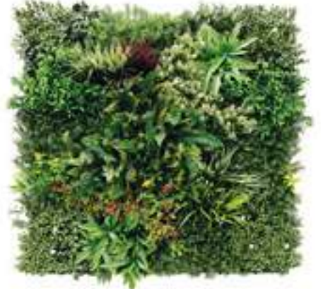
MADAGASCAR modulo/module C U-MAD100-C cm 100 x 100