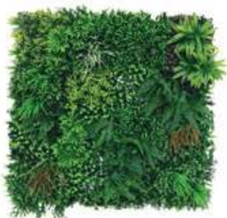
Full Eco-Greenwall Mix Green/Red U.V.R. B-9023X100 cm 100 x 100