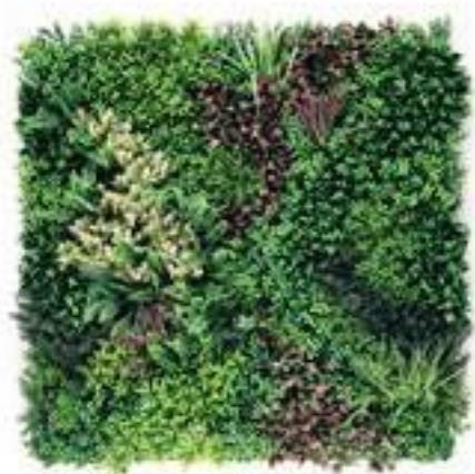
HERA modulo/module A U-A01AX100 cm 100 x 100