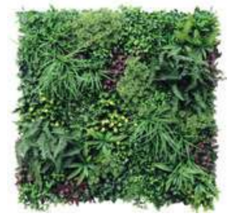
Wonderland U.V.R. U-A060X100 cm 100 x 100