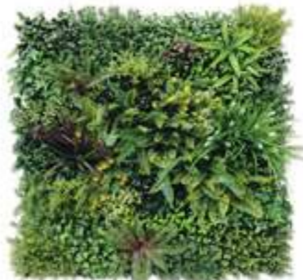
BALI modulo/module C U-BALI100-C cm 100 x 100