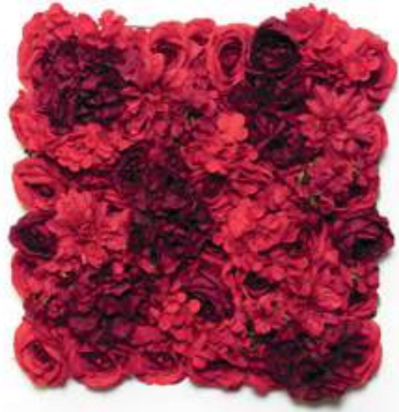
6-13001-R Mattonelle Fiori Rossi Red Flower Mats cm 50 x 50, Pk. 10