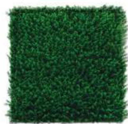
Cipresso - Cypress U.V.R. B-1880x100 cm 100 x 100