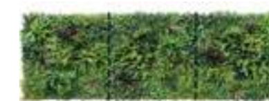
A B C