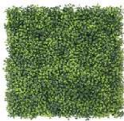
Boxwood Aureovariegato U.V.R. Boxwood Aureovariegatum U.V.R. U-1550X50 cm 50 x 50 cm