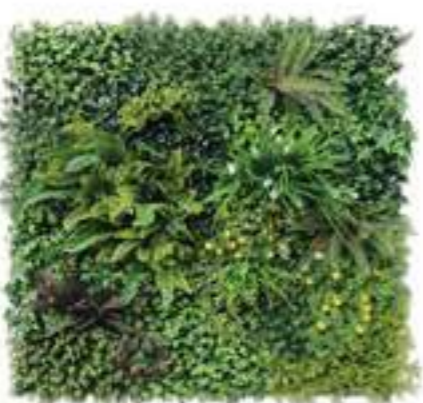
BALI modulo/module B U-BALI100-B cm 100 x 100