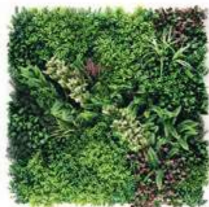
HERA modulo/module C U-A01CX100 cm 100 x 100