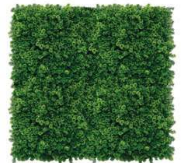
Lichene Artificiale Elegance Artificial Lichen Elegance Mattonelle Lichene UVR UVR Lichen Hedge Mats Col. Verde/Green U-1720X100 cm 100 x 100, Pk. 5