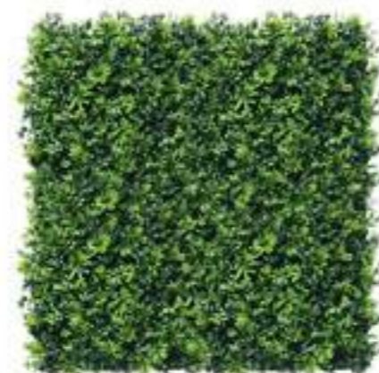
Greensea U.V.R. U-A156X100 cm 100 x 100