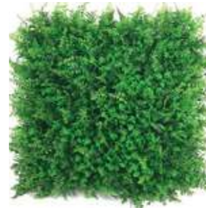
Small Jungle U.V.R. B-9008X50 cm 50 x 50