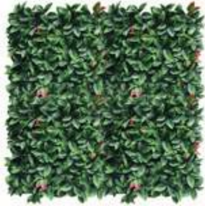
Photinia U.V.R. U-1510X100 cm 100 x 100