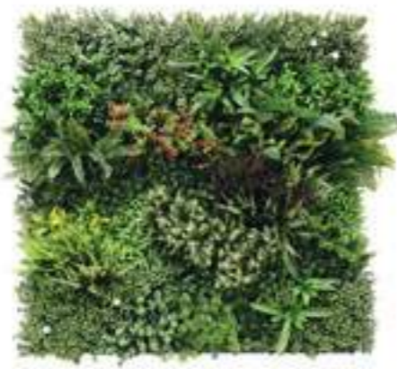
MADAGASCAR modulo/module B U-MAD100-B cm 100 x 100