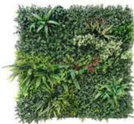
MADAGASCAR modulo/module A U-MAD100-A cm 100 x 100