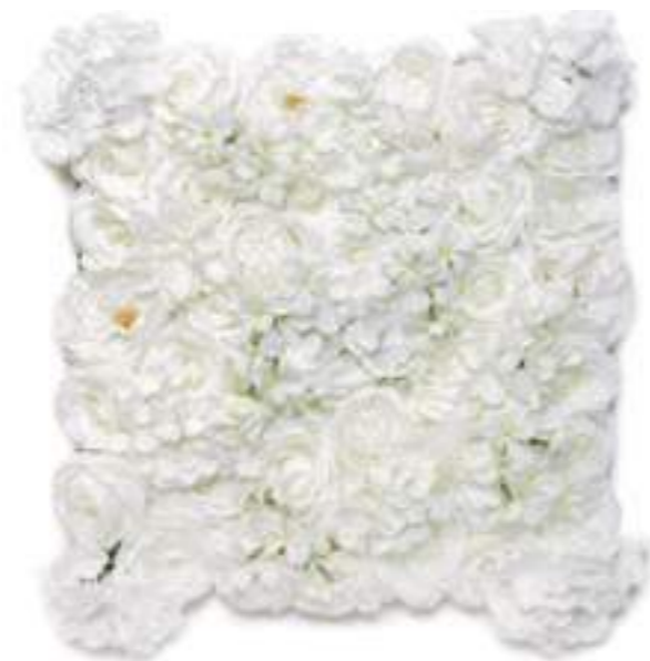
6-13004-W Mattonelle Fiori Bianchi White Flower Mats cm 50 x 50, Pk. 10