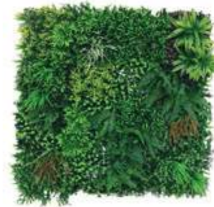
Full Eco-Greenwall Mix Green/Red U.V.R. B-9023X100 cm 100 x 100