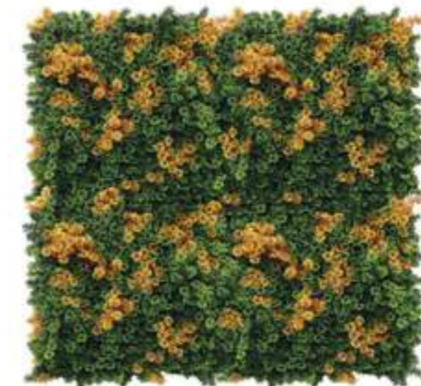
Lichene Artificiale Elegance Artificial Lichen Elegance Mattonelle Lichene UVR UVR Lichen Hedge Mats Col. Verde & Arancio/Green & Orange U-1730X100 cm 100 x 100, Pk. 5