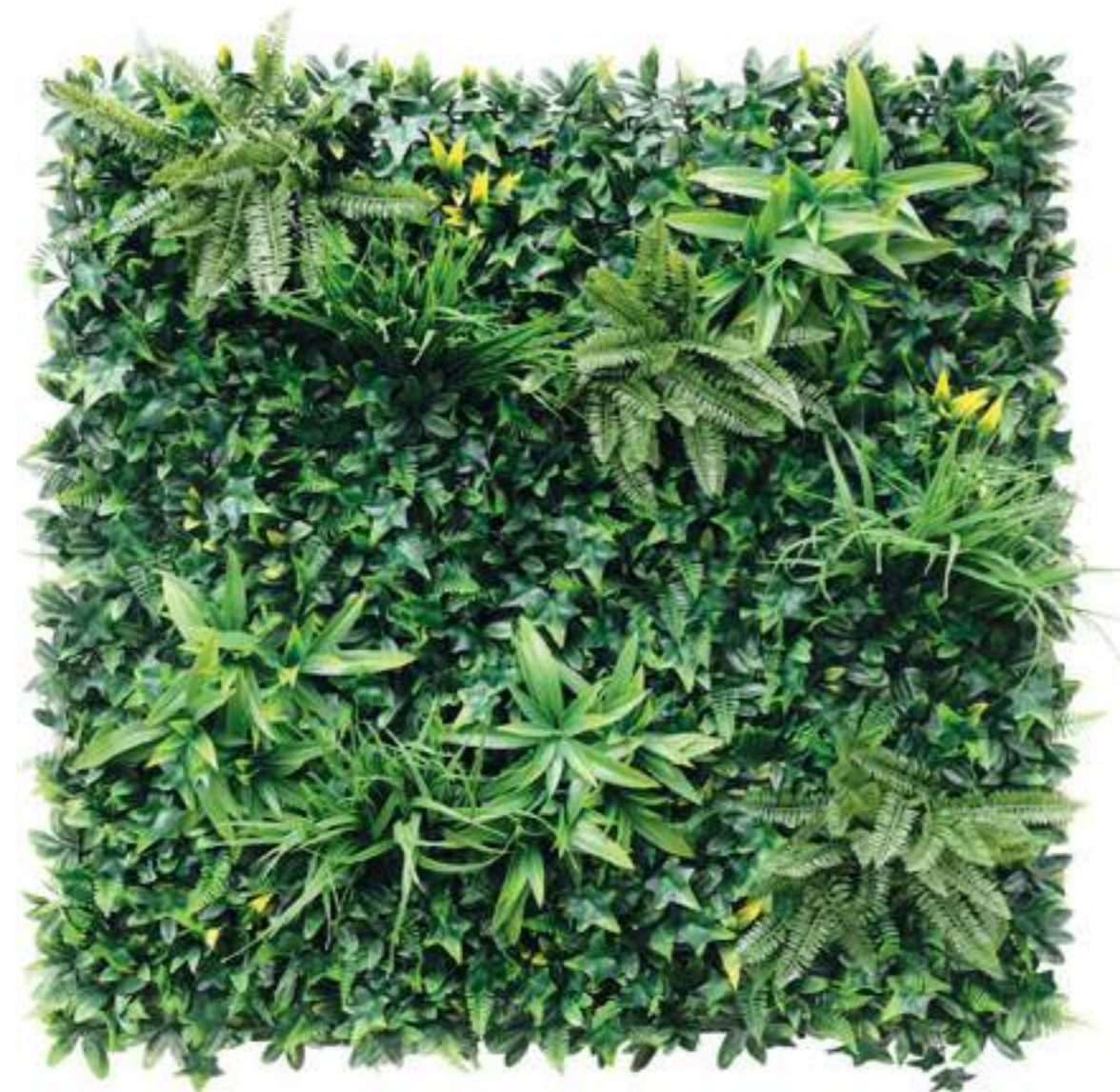
Tenerife Mattonelle Siepe, F.R. - U.V.R. Tiles for Hedge, F.R. - U.V.R. U-TENX100 cm 100 x 100, Pk. 5

La nostra nuova siepe Tenerife , con cespugli di Felce, Fili di Erba, Dracena verde, Edera e Pitosforo, è Fire Retardant e Resistente ai raggi UV . Può essere installata sia indoor che outdoor.