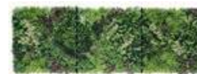
A B C