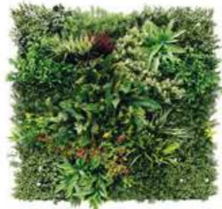
MADAGASCAR modulo/module C U-MAD100-C cm 100 x 100