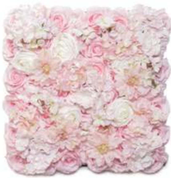
6-13003-LP Mattonelle Fiori Rosa Chiaro Light Pink Flower Mats cm 50 x 50, Pk. 10