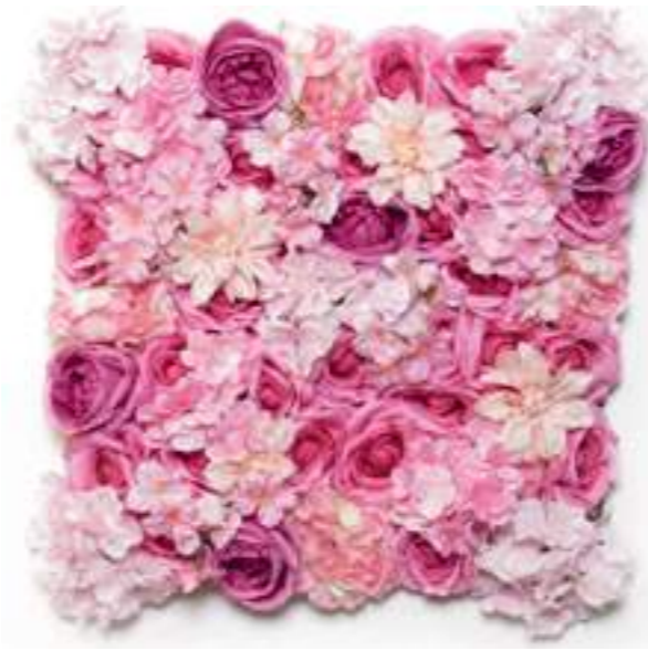
6-13002-DP Mattonelle Fiori Rosa Scuro Dark Pink Flower Mats cm 50 x 50, Pk. 10