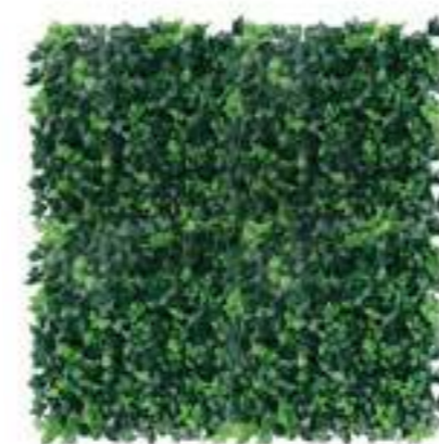
Edera Inglese - English Ivy U.V.R. U-1560X100 cm 100 x 100