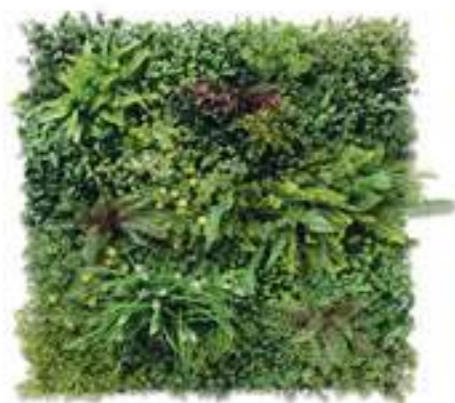
BALI modulo/module A U-BALI100-A cm 100 x 100