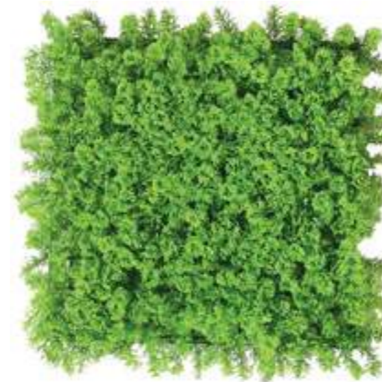
Lichene Artificiale Classic Artificial Lichen Classic Mattonelle Lichene UVR UVR Lichen Hedge Mats U-1530X100 cm 100 x 100, Pk. 6

It can be installed both indoor and outdoor. Tenerife is compliant with the European standards EN 13823:2020+A1:2022 - EN ISO 11925-2:2020 Reaction to Fire Classification: B-s3, d0