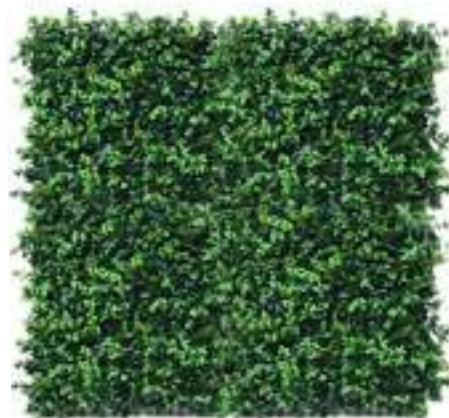
Mix Green Mat U.V.R. U-1570X100 cm 100 x 100