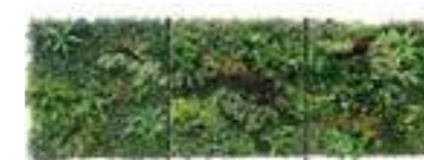
A B C