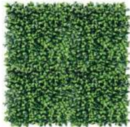
Gardenia U.V.R. U-1540X100 cm 100 x 100