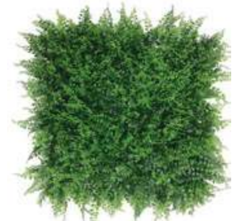
Fern U.V.R. U-A006X50 cm 50 x 50