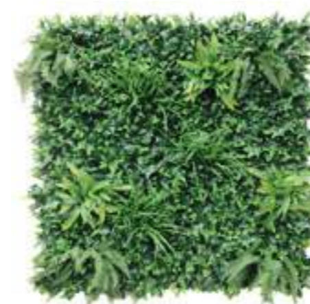
Greenery Low Cost U.V.R. U-1580X100 cm 100 x 100