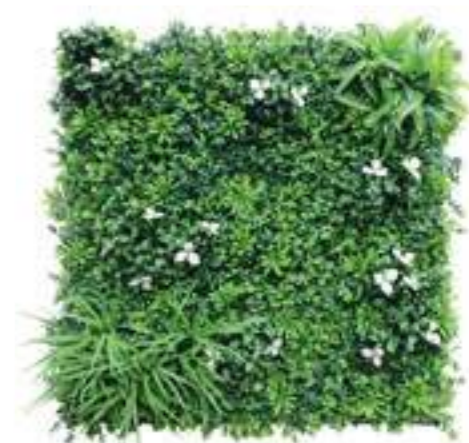
Desert Oasis U.V.R. U-A107X100 cm 100 x 100