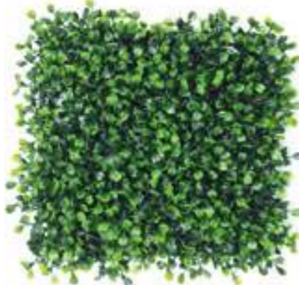
Boxwood U.V.R. D3523A-4 cm 50 x 50 cm D3523A-16 cm 100 x 100