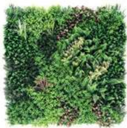
HERA modulo/module B U-A01BX100 cm 100 x 100